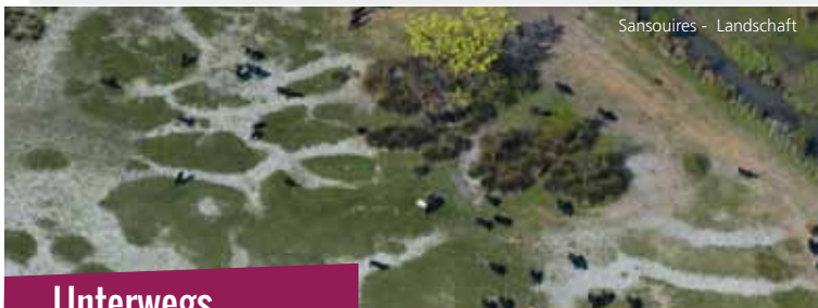
Sansouires - Landschaft

! Achtung: Beachten Sie vor dem Start die Wettervorhersage. Bei Mistralwind sollten Sie nicht wandern oder Fahrrad fahren.