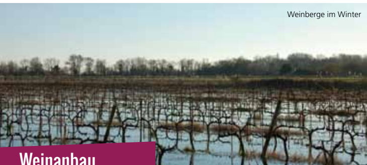
Weinberge im Winter

Der Jakobsweg erinnert an den Apostel Jakob, der im Leben Jesus sehr präsent war und der zwischen 41 und 44 geköpft worden sei. Sein Grab wurde erst unter Karl dem Großen und Alfons II dem Keuschen (759-842) entdeckt. Zahlreiche treue Anhänger erweisen ihm auf diesem Weg ihre Ehre. Die Via Tolosana (von Arles aus) gehört zu den vier möglichen Wegen zum Grab des Heiligen Jakob.