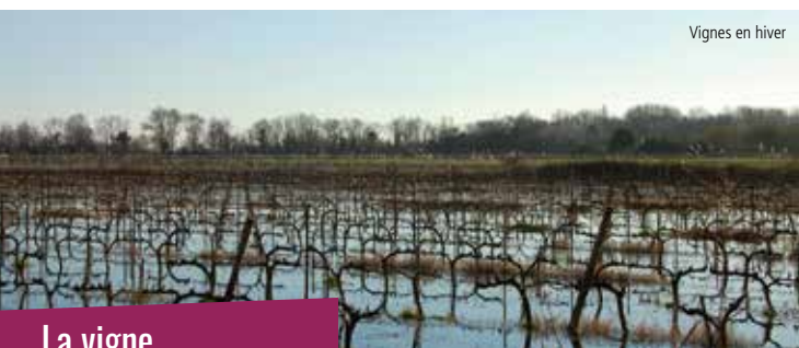
Vignes en hiver

Le chemin de Saint-Jacques de Compostelle rappelle l'apôtre Jacques (présent durant la vie de Jésus) qui aurait été décapité vers 41-44. Ce n'est que sous le règne de Charlemagne et d'Alphonse II le Chaste (759-842) que son tombeau est découvert. De nombreux fidèles lui rendent hommage sur cette route. La Via Tolosana au départ d'Arles est l'un des quatre itinéraires vers le tombeau de Saint-Jacques.