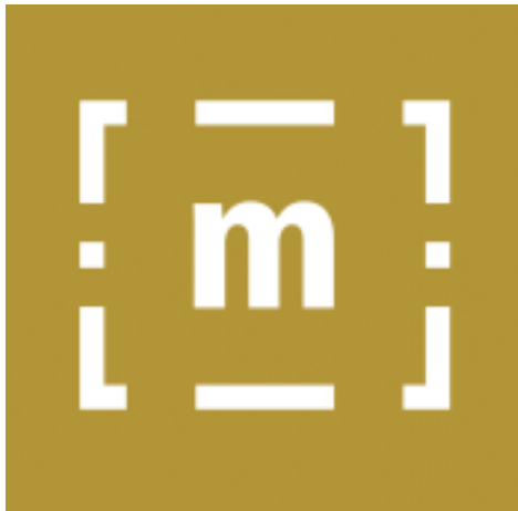
Ce logo permet désormais de repérer les 1200 musées labellisés « Musées de France » dont le musée de la Camargue

Le projet de rénovation du musée de la Camargue commence à prendre tournure. Depuis cet été, le bureau d'étude « Les clefs du patrimoine » chargé d'établir différents cahiers des charges à destination de l'architecte et du scénographe, qui seront ensuite choisis pour la réalisation