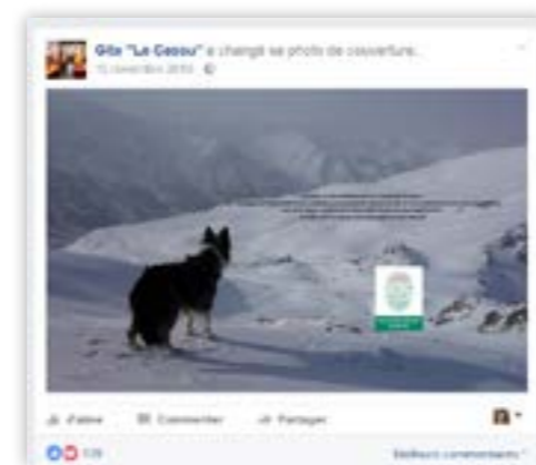
Bannière de la page facebook du gîte La Cassu - Parc naturel régional du Queyras