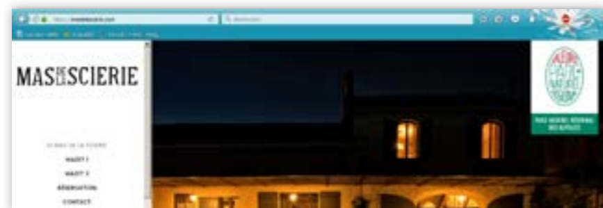
Site internet du Mas de la Scierie - Parc naturel régional des Alpes

(Le Hashtag ou mot-dièse permet de marquer un contenu avec un mot-clé partagé permettant à l'internaute de suivre et commenter un thème précis sur les réseaux sociaux.)