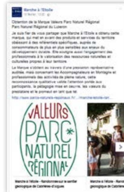
Post sur la page facebook du prestataire Marche à l'Etoile - Parc naturel régional du Luberon