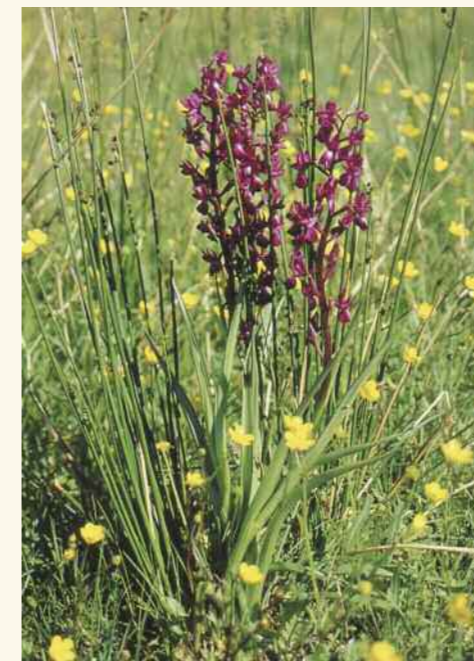
Orchis à fleurs laches.

Contacts : Anne Vadon - Stéphane Arnassant, 04 90 97 10 40, agri.elevage@parc-camargue.fr , natura@parc-camargue.fr