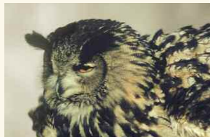
Grand-duc d'Europe.

Soirée gratuite sur réservation au 04 90 97 93 97, (50 places maximum)