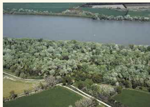
Ripisylve de Beaujeu.

La basse vallée du Rhône et la Camargue concentrent une grande partie des enjeux du Plan Rhône. Ce programme pluriannuel piloté par l'État et les Régions vise à réduire les inondations, la vulnérabilité des biens et des personnes et enfin, entretenir et développer la prise en compte du risque. Au niveau local, et chacun dans son domaine de compétence, le SYMADREM, la Chambre d'agriculture des Bouches-du-Rhône et le Parc de Camargue portent des actions complémentaires pour apporter aux habitants une protection accrue et une organisation optimale face aux caprices du Rhône.