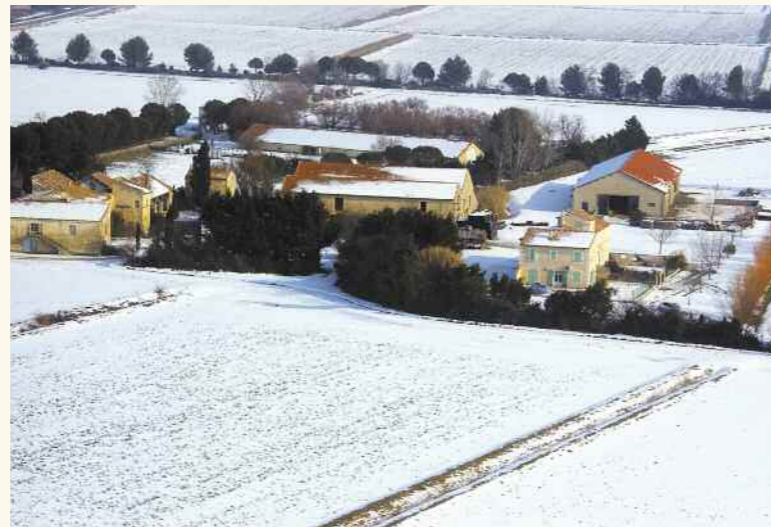
Mas du Pont de Rousty sous la neige.