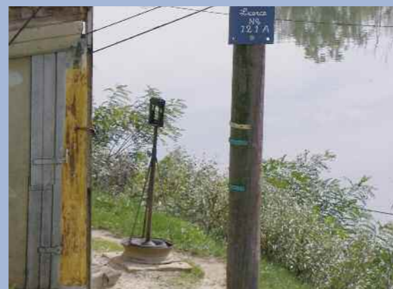
Repère de crue sur un poteau le long du petit Rhône.

Merci de participer à la conservation de la mémoire locale et de maintenir vivante la présence du fleuve.