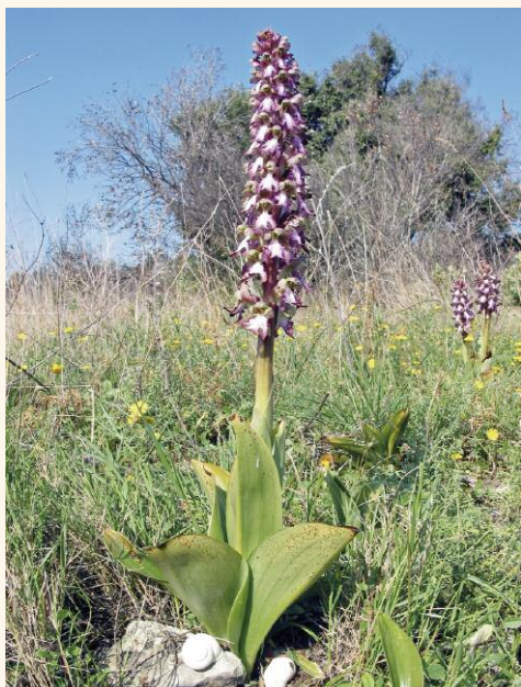
L'Orchis géant, à la floraison précoce, fréquente les pelouses camarguaises...

maintien de la biodiversité des zones humides camarguaises. Cette année le concours s'étend sur le périmètre de la Réserve de biosphère de l'UNESCO (MAB) en intégrant les prairies de Meyranne ou des Chanoines. De plus, un thème spécifique sera développé en 2012, en lien avec la Société française d'orchidophilie, sur l'importance des milieux ouverts par le pâturage pour les orchidées sauvages.