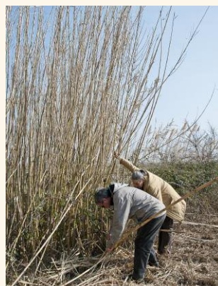
© Laurent Moulin, Chant du roseau.

Renseignements : Musée de la Camargue - Mas du Pont de Rousty - 13200 Arles - 04 90 97 10 82 - Courriel:musee@parc-camargue.fr