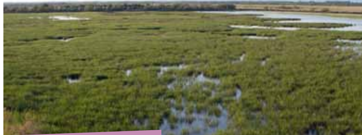
Marais du Vigueirat