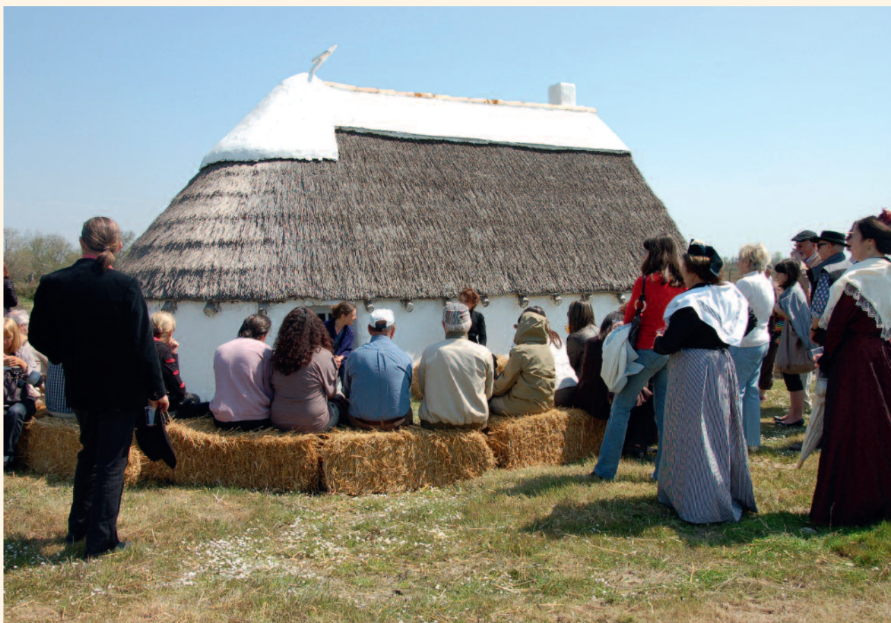
Un spectacle près de la cabane de gardian sur le sentier de découverte du Mas du Pont de Rousty.

Tél. 04 90 97 10 82 / Courriel musee@parc-camargue.fr