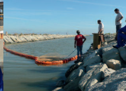
Test de barrage à jupe de déviation.