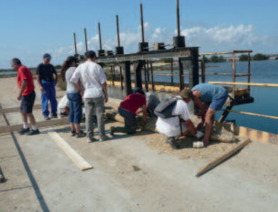
Boudin filtrant en paille.