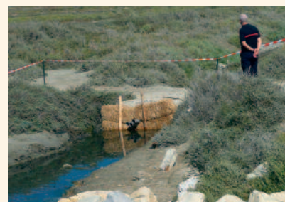
Barrage filtrant en paille de blé.

*CEDRE : Centre de documentation, de recherche et d'expérimentations sur les pollutions accidentelles des eaux.