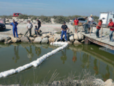
Boudin adsorbant de déviation.