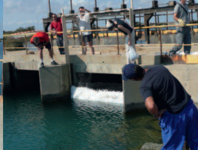
Caisson filtrant sur martelière.