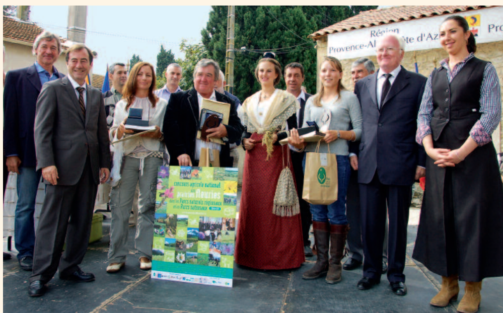
La remise des prix du concours des prairies fleuries.

Contacts : Stéphan Arnassant, natura@parc-camargue.fr - Anne Vadon, agri.elevage@parc-camargue.fr - 04 90 97 10 40