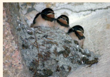
Hirondelles rustiques

Contact : Stéphan Arnassant, tél : 04 90 97 10 40