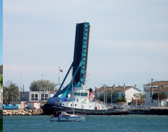
Port-Saint-Louis-du-Rhône ; le port, la tour Saint Louis, l'écluse.