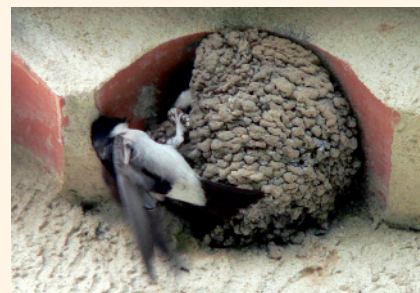
Hirondelle de fenêtre