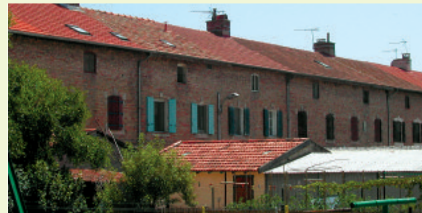
Cité ouvrière à Salin-de-Giraud.

La réduction de la production de sel du groupe Salin a entraîné la vente d'une partie importante de ses terrains au Conservatoire du littoral. Depuis 2008, la gestion du domaine de la Bélugue (2071 ha) a été confiée au Parc naturel régional de Camargue.