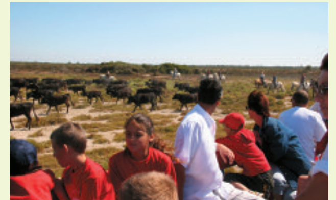
Visite organisée d'une manade.

Le « schéma de tourisme durable du PNR de Camargue 2010-2015 » est téléchargeable sur le site internet du Parc à : www.parc-camargue.fr rubrique « Dossiers »