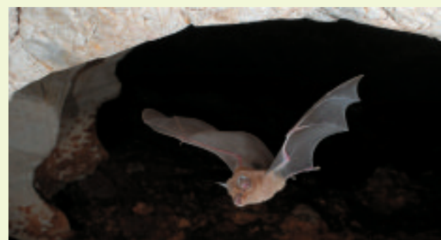
Grand Rhinolophe.

Contact : Gaël Hemery, Régis Vianet, 04 90 97 10 40, espaces.naturels@parc-camargue.fr