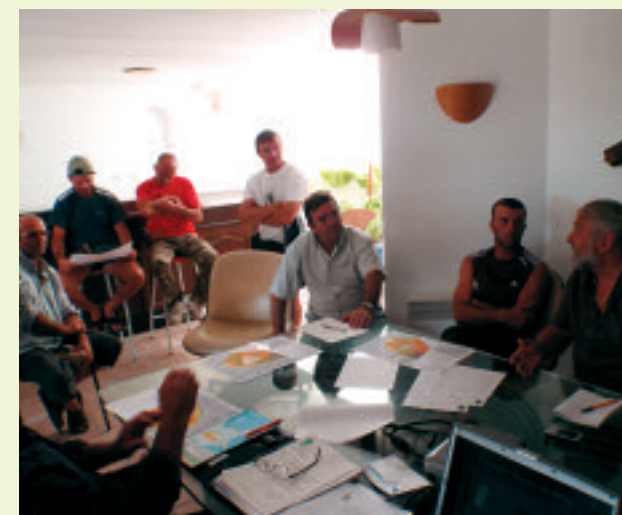
Réunion de concertation avec les pêcheurs professionnels.

L'année 2010 sera consacrée au montage administratif et financier nécessaire à la création du cantonnement de pêche en 2011.