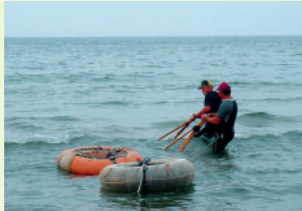
Pêcheur de tellines.

Contact : Delphine Marobin, 04 90 97 10 40, littoral@parc-camargue.fr