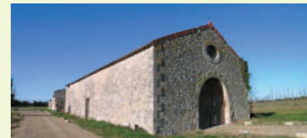
Cave du mas de l'Ange des Sansouïres.

Voici quelques années le Parc a entamé un inventaire du patrimoine bâti du territoire. Cette recherche a permis de confirmer l'extraordinaire richesse du patrimoine architectural camarguais parfois méconnu. Dans cet esprit, deux ouvrages de référence sur le thème « Habiter le Parc naturel régional de Camargue » vont être diffusés en 2010.