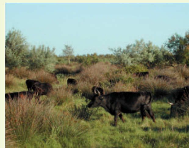
Pâturage de taureaux.

Contact : Anne Vadon, 04 90 97 10 40, agri.elevage@parc-camargue.fr