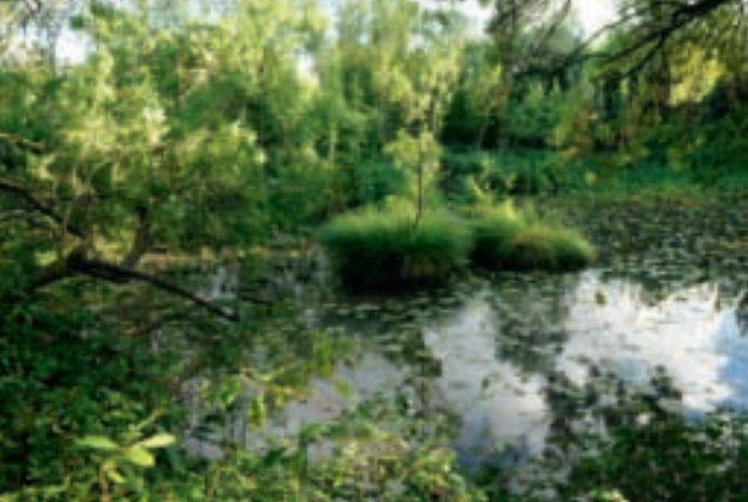
Marais de Beauchamp