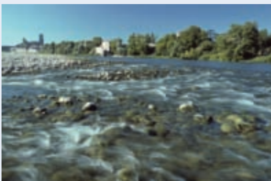
Le Rhône à Pont-Saint-Esprit

D'ailleurs Gilles Dumas rappelle que : « La démarche Natura 2000 doit être perçue ici dans le contexte du Plan Rhône et de sa vocation à concilier enjeux économiques – la navigation, l'énergie – et écologiques. L'intérêt du site est qu'il