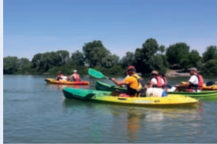
Kayak sur le petit Rhône

1- L'objectif est de 10 % d'énergie éolienne en 2020. Avec la libération du marché de l'énergie, la CNR est non seulement devenue gestionnaire des centrales hydroélectriques au fil de l'eau mais s'engage dans le développement de l'éolien le long du Rhône.