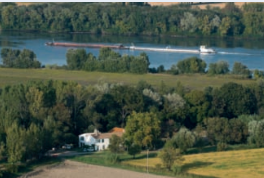
Le grand Rhône à Mas Terrin