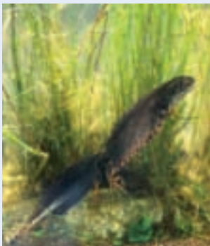
Triton crêté

De l'autre côté, un fleuve au patrimoine naturel encore assez remarquable qui comprend une faune piscicole de grand intérêt (plusieurs espèces migratrices ou patrimoniales comme le toxostome, la bouvière, le blageon, le barbeau méridional, l'alose feinte du Rhône voire même l'Apron du Rhône...),