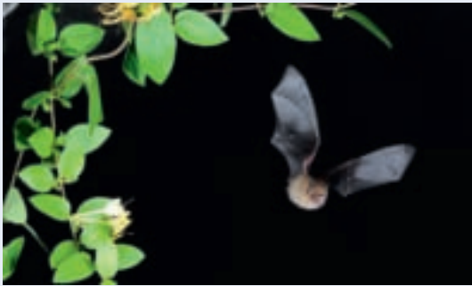
Murin © J.-M. Bompar