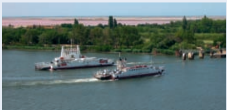
Le grand Rhône et le bac de Barcarin