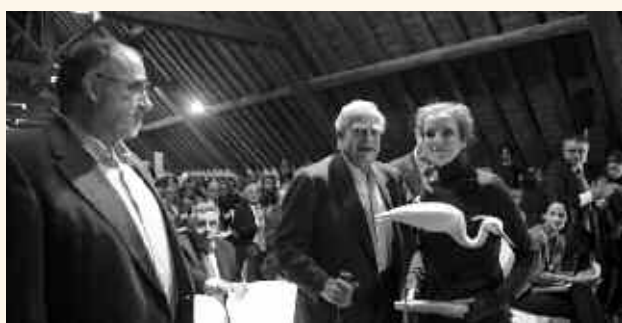
Ces journées ont aussi été l'occasion d'honorer l'action de Luc Hoffmann pour la préservation des zones humides.

Plus de 200 personnes, venues de toute la France métropolitaine et d'outre-mer à l'occasion du 3 ème séminaire des animateurs de sites Ramsar, étaient présentes lors de cette signature qui s'inscrit dans le cadre des 40 ans de la Convention de Ramsar.