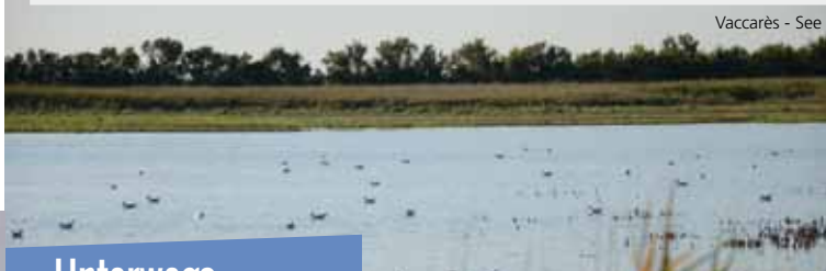
Vaccarès - See

! Achtung: Beachten Sie vor dem Start die Wettervorhersage. Bei Mistralwind sollten Sie nicht wandern oder Fahrrad fahren.