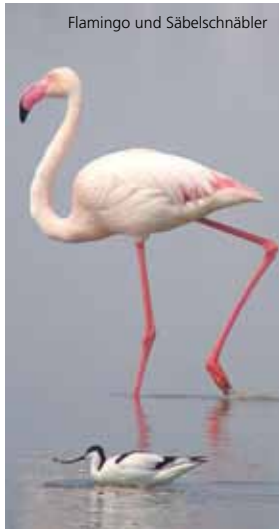
Flamingo und Säbelschnäbler

Das Naturschutzgebiet Camargue wurde 1927 von der Société Nationale de Protection de la Nature ins Leben gerufen. Sie hatte zur Aufgabe, die hiesige Fauna und Flora zu schützen. Das Gebiet erstreckt sich über 13 117 ha, einen Großteil davon nimmt der Vaccarès-See ein. Die Capelière ist das Informationszentrum des Naturschutzgebiets. Hier gibt es Erkundungswege, Ausstellungen und Informationsmaterial.