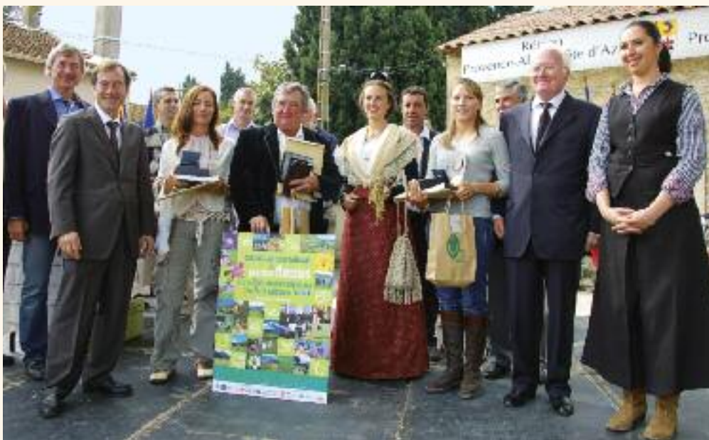
La remise des prix du concours des prairies fleuries.

Contacts : Stéphan Arnassant, natura@parc-camargue.fr - Anne Vadon, agri.elevage@parc-camargue.fr - 04 90 97 10 40