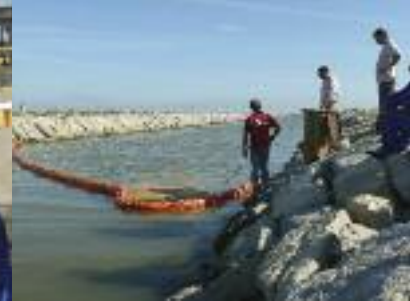
Test de barrage à jupe de déviation.