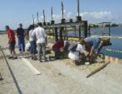
Boudin filtrant en paille.