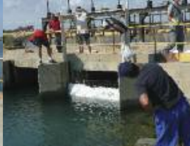
Caisson filtrant sur martelière.