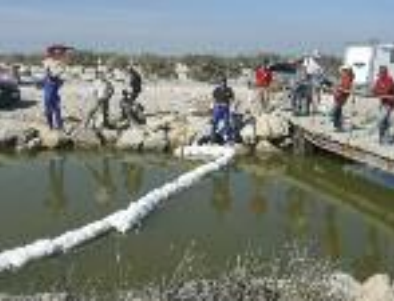
Boudin adsorbant de déviation.