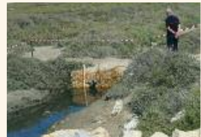
Barrage filtrant en paille de blé.

Contact : Delphine Marobin, littoral@parc-camargue.fr, 04 90 97 10 40