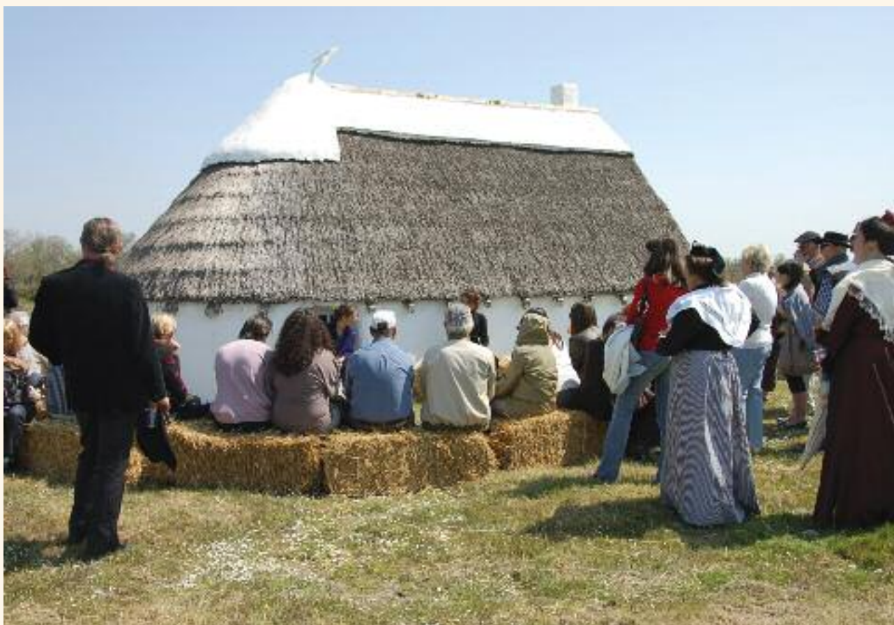
Un spectacle près de la cabane de gardian sur le sentier de découverte du Mas du Pont de Rousty.

Tél. 04 90 97 10 82 / Courriel musee@parc-camargue.fr