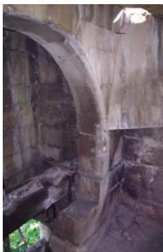
puits à crémaillère de Gageron

L'inventaire du patrimoine bâti est en marche... nous vous remercions pour votre participation et votre soutien. Plus de 150 édifices ont déjà été recensés. Bientôt des expositions débats seront organisés dans les hameaux... Continuez à nous informer.