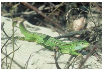
Lézard vert

Pour plus d'information : Anthony Olivier (Tour du Valat), 04 90 97 20 13, Gaël Hemery, 04 90 97 10 40