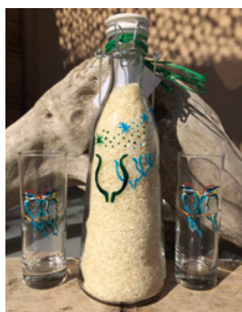
La Vénus d'Olives

ET PENDANT L'ÉTÉ, TOUS LES DIMANCHES DE 9H À 13H, un marché de producteurs et d'artisans de Camargue s'installe aux abords du musée. Un cadre bucolique pour découvrir la gastronomie et les savoir-faire du territoire. Animations pour enfants. 11H : visite guidée de l'exposition permanente. Payant, sur inscription au musée.