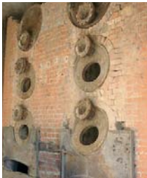
Fours à bois des anciennes pompes à vapeur de la station du Japon