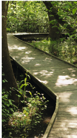
Sentier dans la ripisylve