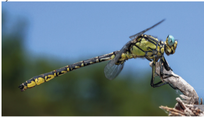
Gomphe de Graslin