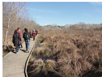
Sentier en bordure de marais à marisque

Pour contribuer à faire de ce site complexe aux enjeux multiples, un lieu partagé, à vocations environnementales et sociales, le CPIE Rhône-Pays d'Arles et la mairie d'Arles agissent pour favoriser le dialogue entre les habitants, les usagers, les acteurs et les gestionnaires du site.