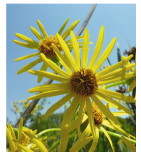
Sénécon des marais