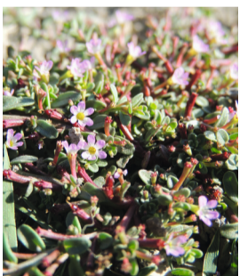
Lythrum à trois bractées