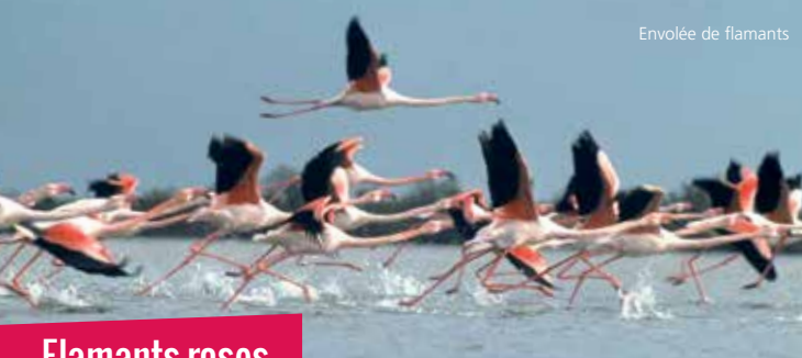
Envolée de flamants