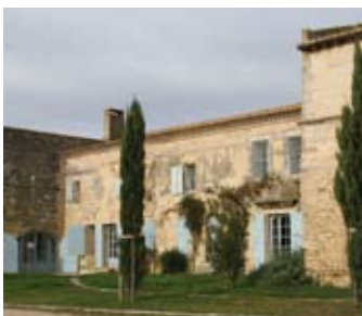
> Le Mas du Pont de Rousty, siège du Parc