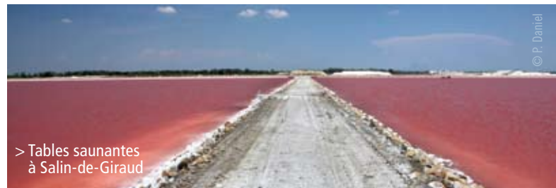
> Tables saunantes à Salin-de-Giraud