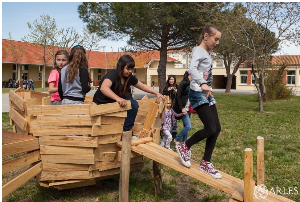
Le nid-bonbon de l'école de Salin-de-Giraud, 2015

Le programme des Sentiers de l'eau associe architecture, environnement et construction. Il s'appuie sur un projet existant de construction d'observatoires en bois sur le territoire du Parc naturel régional de Camargue, dessinés par un artiste de renommée internationale : Tadashi Kawamata. Les élèves font appel à leur imagination et leur créativité pour construire ensemble une œuvre « à la manière de Tadashi Kawamata ».